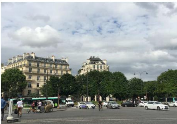
Etat de l'existant :