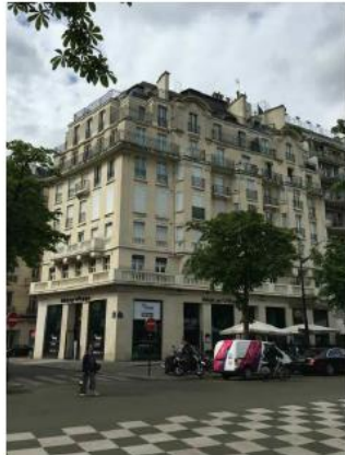
Etat du projet :