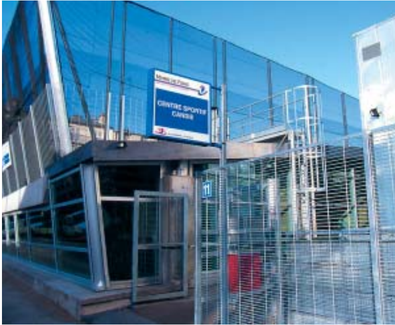
Un soutien aux équipements sportifs de proximité (gymnase Candie - 11 e )

Ces investissements atteignent, cette année, 817 millions d'euros. Ils sont destinés prioritairement aux équipements de proximité dans les quartiers qui en ont le plus besoin.