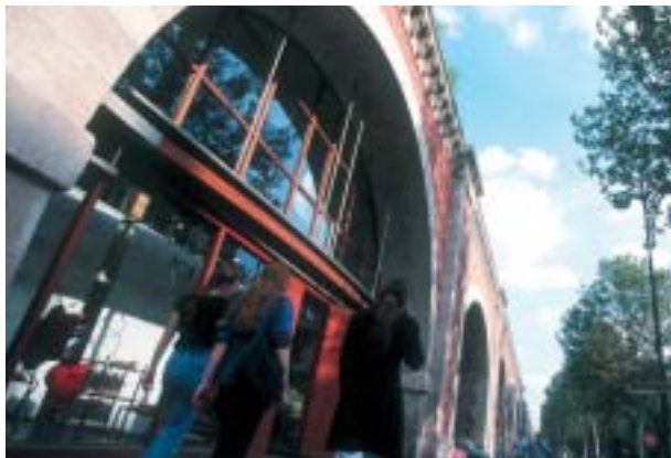
Le Viaduc des Arts (12 e )

dont 75 000 étrangers sont attendus à Paris expo, porte de Versailles, et à Paris-Nord Villepinte. Un grand rendez-vous qui devrait générer de fortes retombées économiques et conforter Paris comme pôle majeur de la création sur la scène internationale.