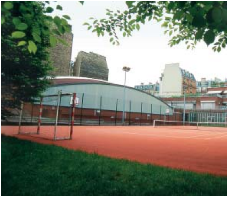
Des terrains d'éducation physique rénovés

clubs et équipes de prévention ou sur la poursuite de la mise en place de « correspondants de nuit » dans le parc HLM. Par ailleurs, une dotation de 14 millions d'euros est prévue afin d'améliorer l'éclairage public.