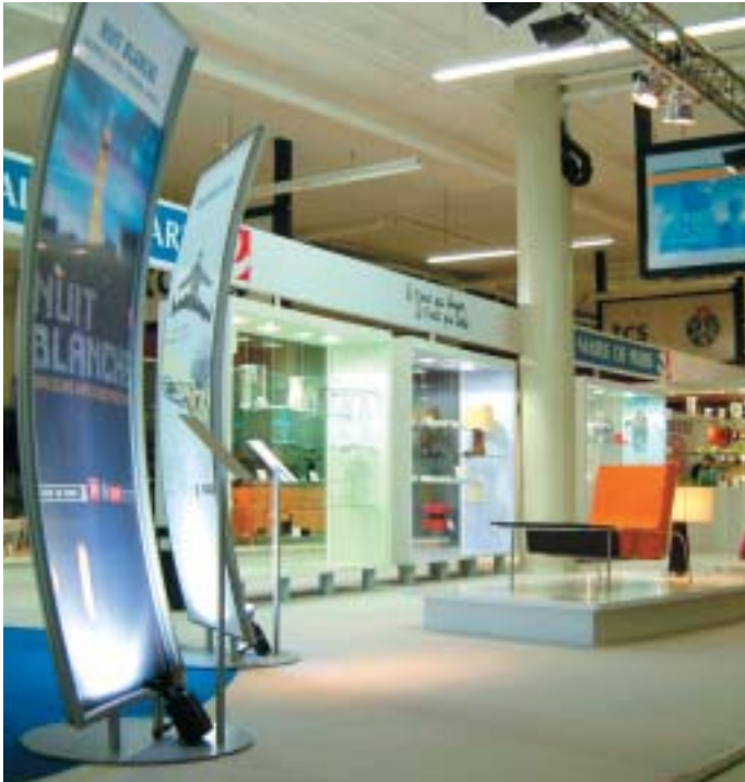
LE STAND DE LA MAIRIE DE PARIS A LA FOIRE DE GENEVE

Ainsi, les écoles municipales, les bourses, les Grands Prix de la création ou les « Bou-