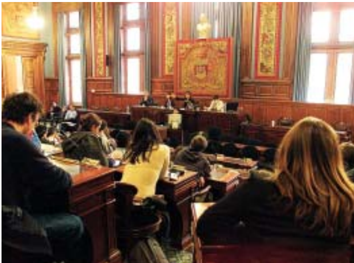
CONSEIL DE LA CITOYENNETE D'OCTOBRE 2002

ville sur les réseaux cyclables et l'organisation d'opérations de communication et de sensibilisation. Dans le même esprit, la mise en place d'un système de covoiturage (en véhicule individuel ou en taxi) a été soulevée par les membres du Conseil. Autre point