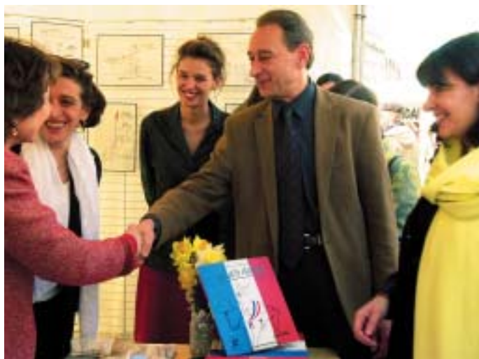
VISITE AU VILLAGE DES ASSOCIATIONS LE 8 MARS 2002

apporter ? Autant de questions qui seront abordées lors de cet événement notamment dans le cadre de colloques et débats organisés à l'Hôtel-de-Ville autour de thèmes tels que : « Les Parisiennes et l'emploi » ou « Les familles contemporaines ». Point d'orgue de cette opération : l'installation d'un « village » d'associations féminines et