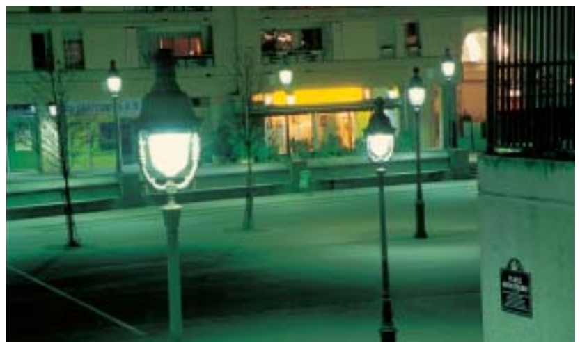
Un éclairage public amélioré (place Henri-Frenay - 12 e )

Dans le domaine de la sécurité et de la prévention, tout en poursuivant un travail de fond, la Mairie de Paris augmente sa contribution au budget de la Préfecture de Police, ce qui permettra par exemple à la modernisation de la brigade des sapeurs pompiers de Paris ainsi qu'à des hausses d'effectifs, notamment des agents de surveillance de Paris. Parallèlement, un effort significatif porte sur le recrutement d'éducateurs des