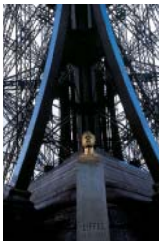
BUSTE DE GUSTAVE EIFFEL SOUS LE PILLIER NORD

Or, aujourd'hui, les conditions d'accueil ne sont plus adaptées à l'afflux toujours croissant du public qui doit patienter, en plein air, près d'une heure en moyenne avant d'arriver aux caisses. Il est donc prévu de réaliser de nouvelles installations dans les sous-sols pour moderni-