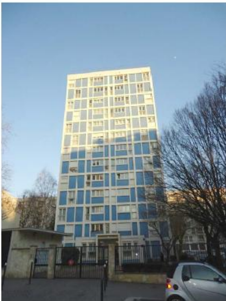
DP 6.1 - Photo du projet (Les antennes sont invisibles depuis ce point de vue)