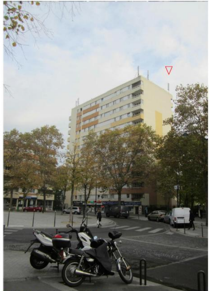
DP 6 Photomontage du projet