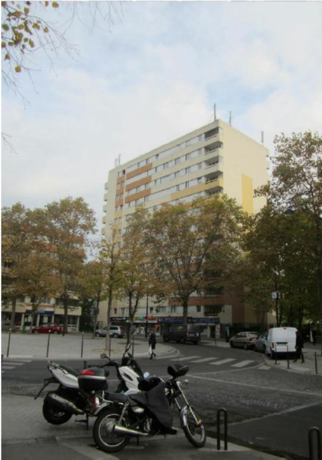
DP 7 Photo de l'existant

REPLACEMENT À L'IDENTIQUE SANS IMPACT VISUEL