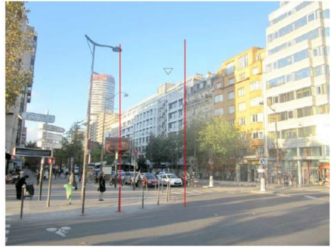
DP 8 - Photo de l'existant, vue lointaine