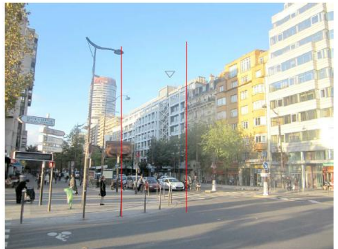
DP 8 - Photo du projet, vue lointaine