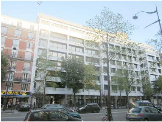
DP 7.1 - Photo de l'existant

REPLACEMENT À L'IDENTIQUE SANS IMPACT VISUEL