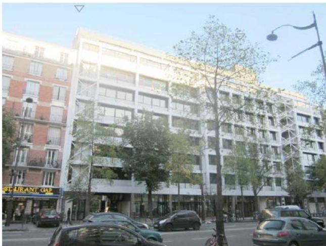
DP 6.1 - Photo du projet