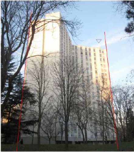
DP 7.1 - Photo de l'existant

REPLACEMENT À L'IDENTIQUE SANS IMPACT VISUEL