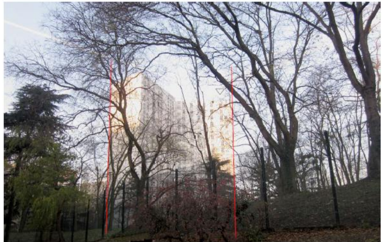
DP 8 - Photo du projet, vue lointaine