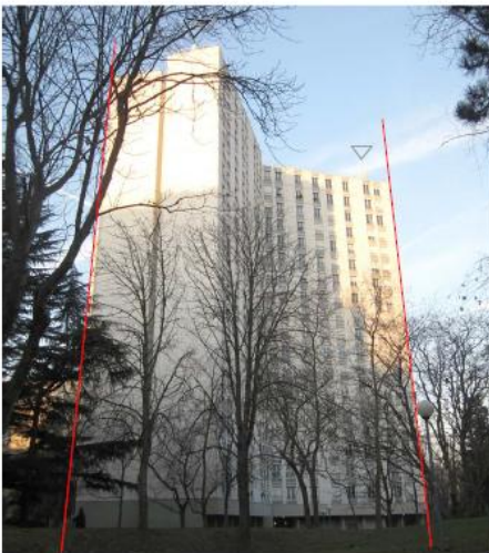
DP 6.1 - Photo du projet