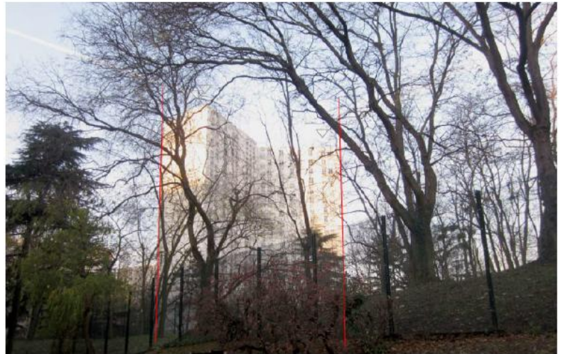
DP 8 - Photo de l'existant, vue lointaine