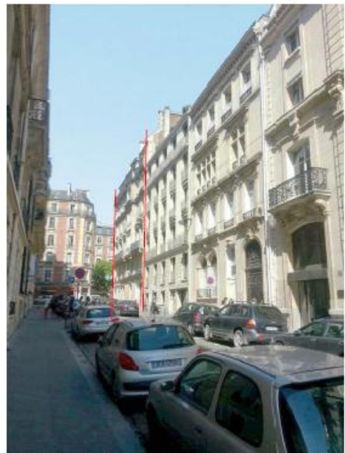
DP 8 - Photo du projet, vue lointaine (L'installation n'est pas visible depuis la rue)