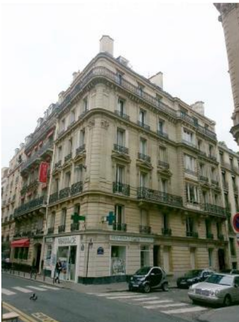
DP 6.1 - Photo du projet (L'installation n'est pas visible depuis la rue)