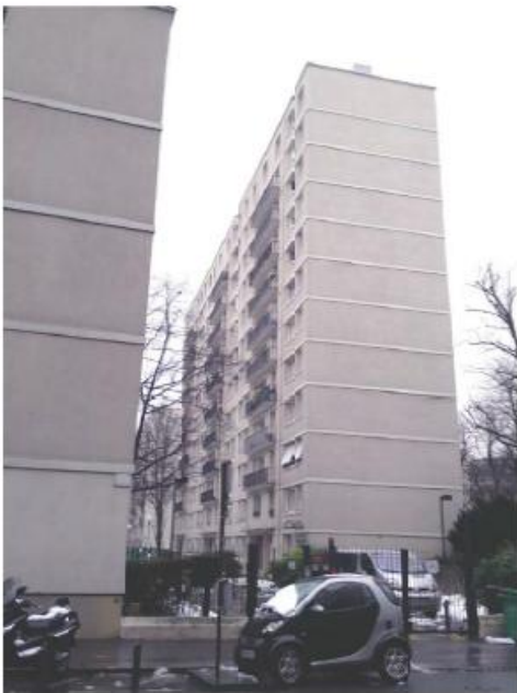
DP 6.1 - Photo du projet (l'antenne est invisible depuis ce point de vue)