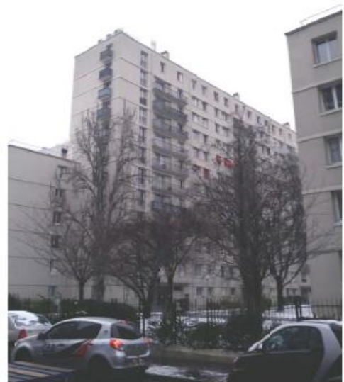
DP 8 - Photo du projet, vue lointaine (l'antenne est invisible depuis ce point de vue)