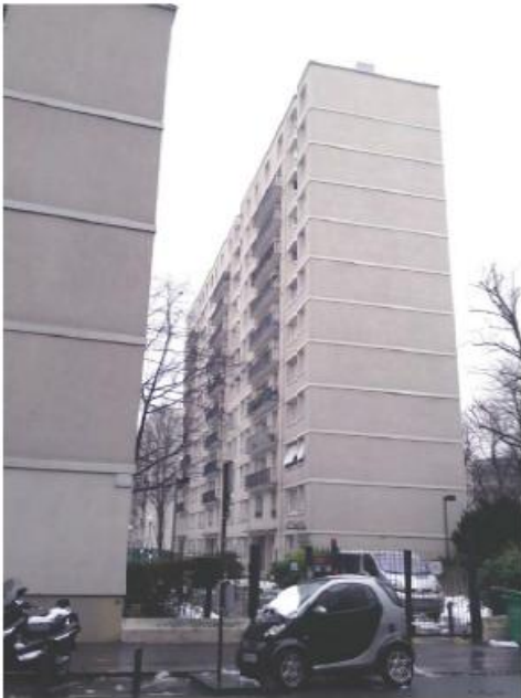
DP 7.1 - Photo de l'existant