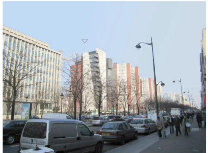
DP 8 - Photo du projet, vue lointaine