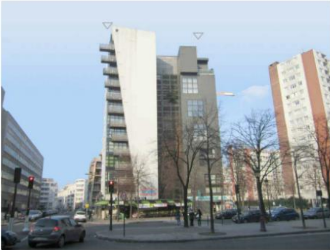
DP 7.1 - Photo de l'existant

REPLACEMENT À L'IDENTIQUE SANS IMPACT VISUEL