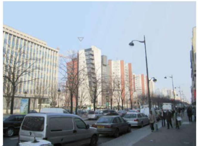
DP 8 - Photo de l'existant, vue lointaine