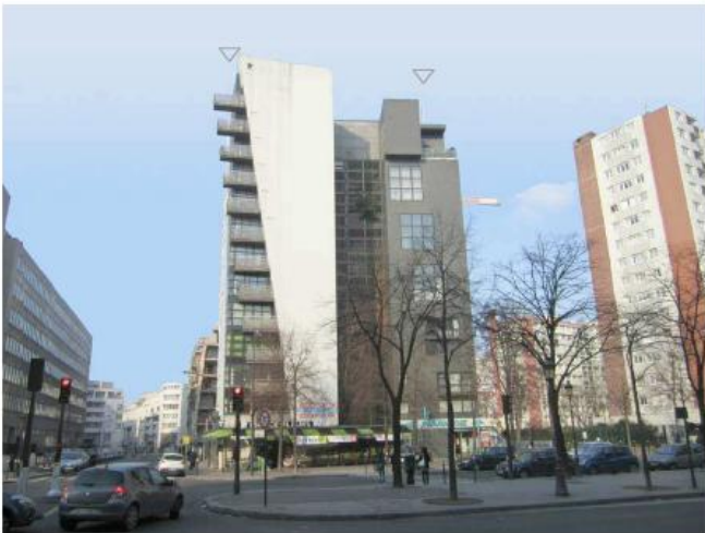
DP 6.1 - Photo du projet