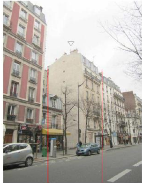
DP 8 - Photo de l'existant, vue lointaine