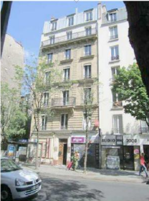
DP 7.1 - Photo de l'existant