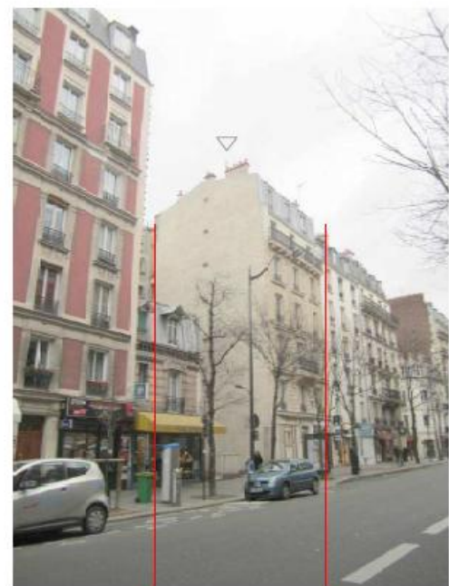
DP 8 - Photo du projet, vue lointaine