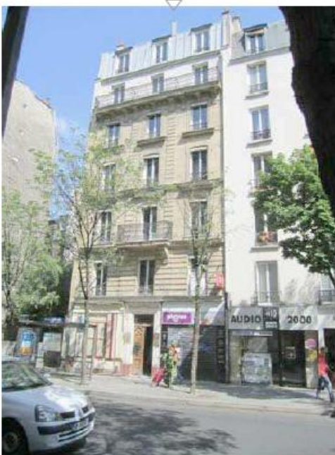
DP 6.1 - Photo du projet