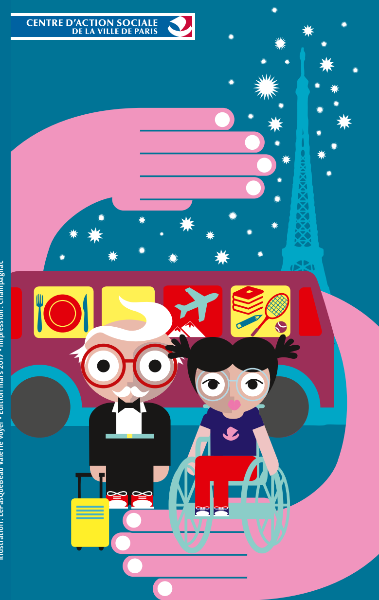
Illustration : LePasQueBeau Valérie Voyer - Édition mars 2017 - Impression : Champagnac

*Prix d'un appel local à partir d'un poste fixe sauf tarif propre à votre opérateur