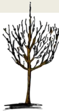
Fuseau (10 m 2 )