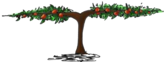
Cordon double (3 m 2 )