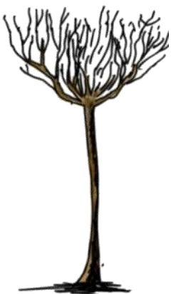
Tige (20 m 2 )