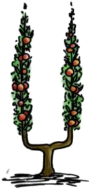
U simple (1 m 2 )