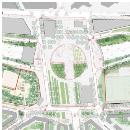
Nouveau schéma d'aménagement proposé