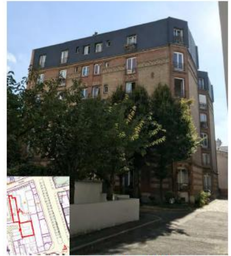
L'antenne n'est pas visible